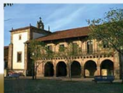
Museo de la Naturaleza de Cantabria (Carrejo, Cabezón de la Sal)